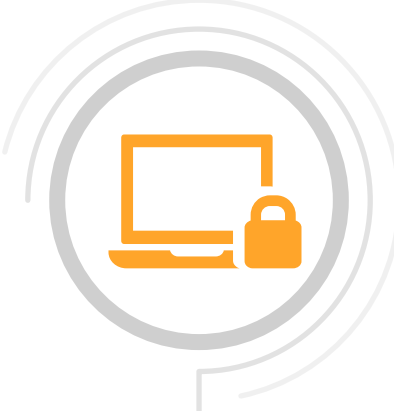
Seguridad de extremos