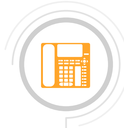
Telefonía por IP