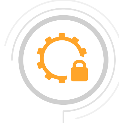
Seguridad de aplicaciones web