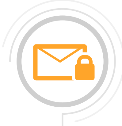
Seguridad de correo electrónico